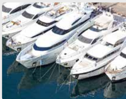
Яхты в порту

Прибор Vulcan для обработки воды представляет собой экологичное бесшумное решение для предотвращения накипи и коррозии на яхтах.