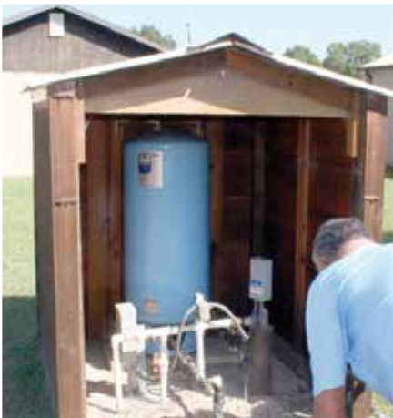
Sistema de agua de pozo en el hogar