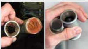
Sistema de tuberías