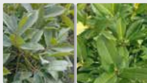
Plantas y jardines