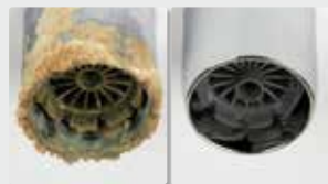
Boquilla de un grifo