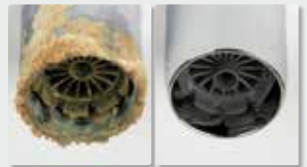
Boquilla de un grifo