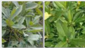
Plantas y jardines