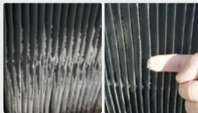
Grilles des tours de refroidissement