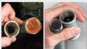
Sistema de tuberías