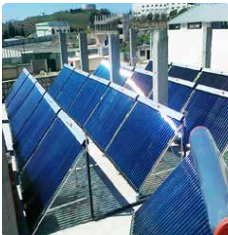
Paneles de energía solar en un edificio de apartamentos