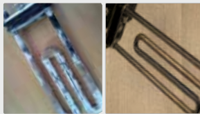
Elemento de calefacción