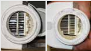
Filtro de la piscina