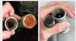
Sistema de tuberías