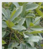
Liście roślin uprawnych