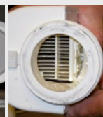
Basenowe urządzenie do chlorowania wody