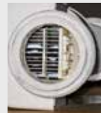
Filtro para piscina