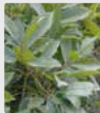
Plantas y césped