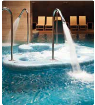
Piscina de agua salada termal

Las piscinas son sistemas con circuito medio abierto que pierden agua constantemente a medida que el agua se evapora. Incluso unos índices bajos de dureza de agua ocasionan depósitos calcáreos dañinos que exigen una limpieza constante. Vulcan disminuye los trabajos de limpieza en la piscina, como en las tuberías, baldosas, rejillas, pisos y paredes. La manutención de duchas, cabezales, grifos e inodoros se facilita sustancialmente.