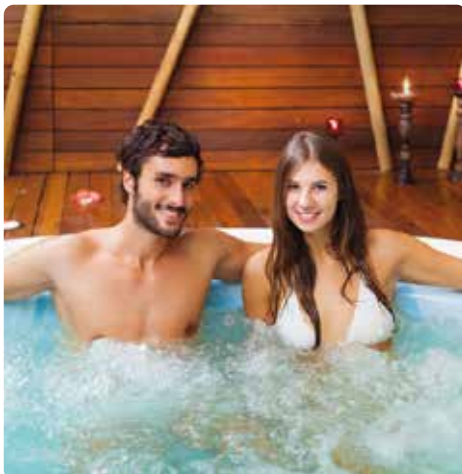
Piscina de hidromasaje en el área de spa de un hotel