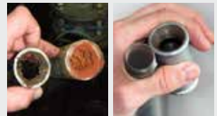
Sistema de tuberías