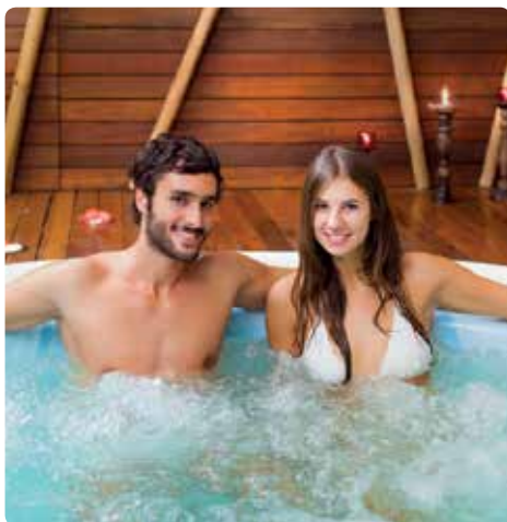
酒店健康区的漩涡浴缸