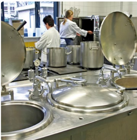
军用船上的专业厨房