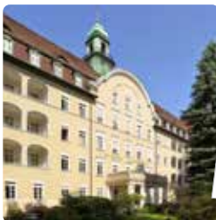
Hospital de St. Joseph, Berlín