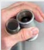
Sistema de tuberías