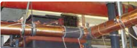
Vulcan S250 instalado en el Hospital St. Joseph

Sin duda, recomiendo sin duda alguna la unidad instalada de Vulcan S250 por CWT GmbH."