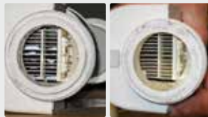
Filtro de piscina