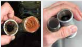
Sistema de tuberías