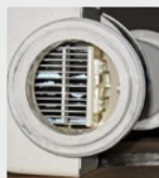
Filtro de piscina