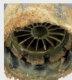
Griño de agua