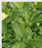
Растения и газоны