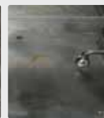
Поддон гриля в клубном ресторане