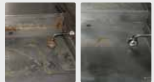
Parrilla de una cocina profesional