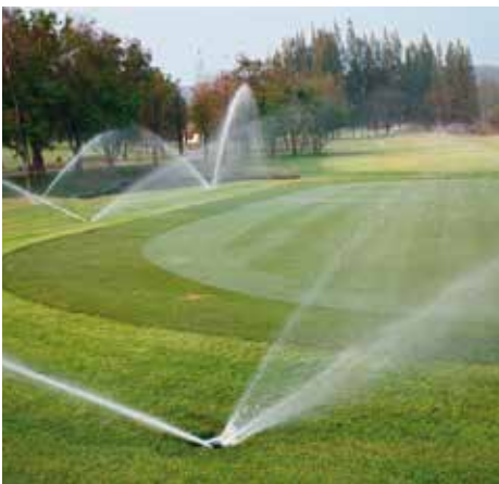
Sistema de aspersores en un campo de golf