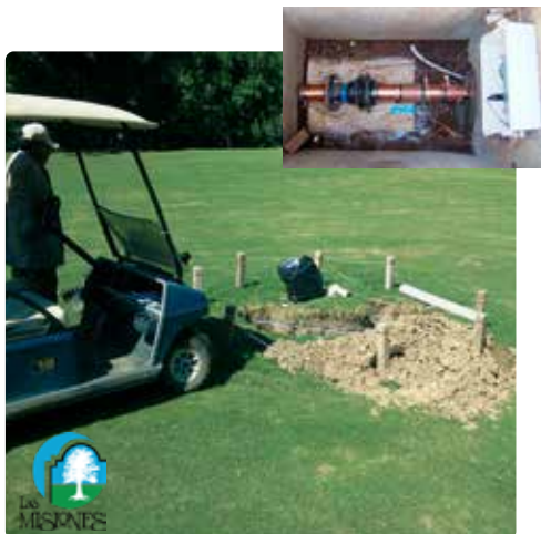
Instalación subterránea en el campo de golf Las Misiones