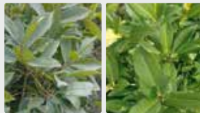
Plantas de invernadero