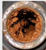
Boru sisteminde biyofilm