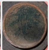
Biofilm présent sur un tuyau