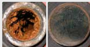
Biopelícula en un sistema de tuberías