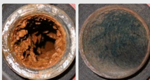
Biopelícula en un sistema de tuberías