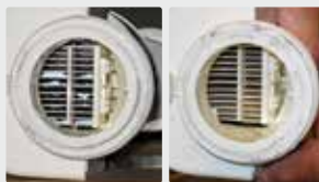
Filtro de piscina