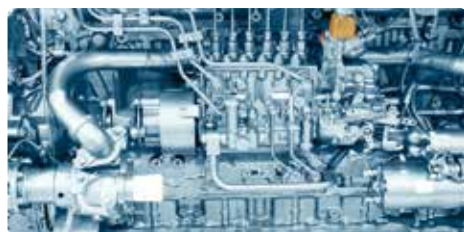
Artefactos de cocina (arriba)