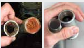
Sistema de tuberías