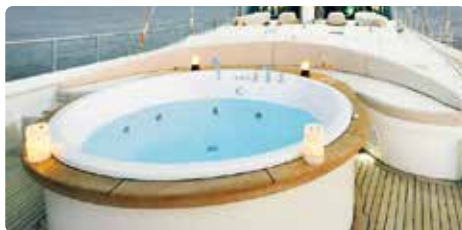
Jacuzzi en la cubierta de un yate de lujo