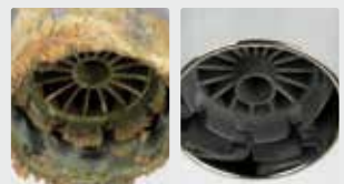
Grifo de agua