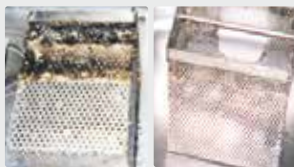
Colector de grasa