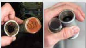
Sistema de tuberías