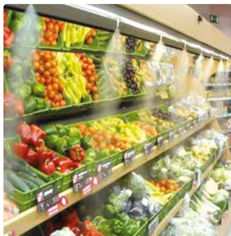
Nebulizadores en expositores de alimentos