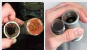
Sistema de tuberías