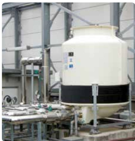
Torre de refrigeración