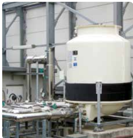
Torre de refrigeración