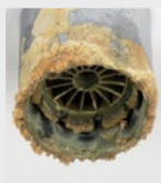
Buse des robinets