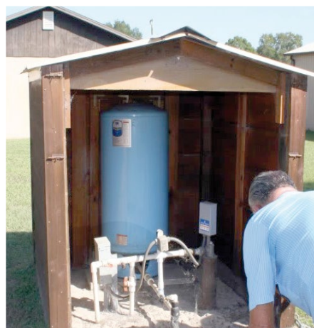
Système d'approvisionnement en eau de forage domestique