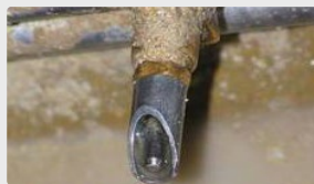
Abreuvoir parfaitement propre