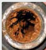
管道系统中的生物膜