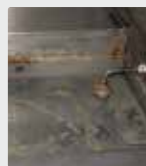
俱乐部餐厅的烧烤盘