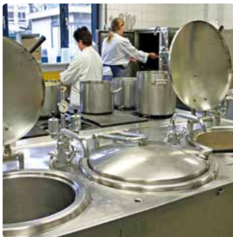
海事船上专业厨房