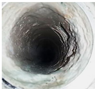
2 semaines après l'installation de Vulcan, le calcaire s'est amolli et est tombé.