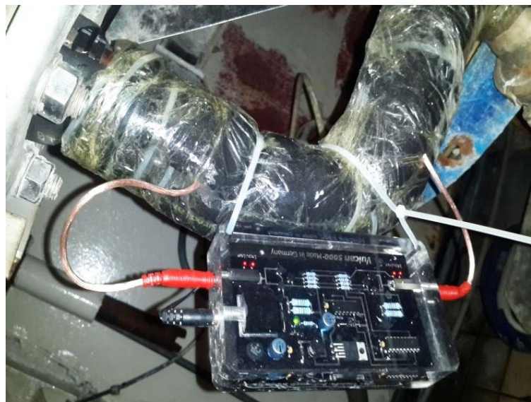
Vulcan 5000 a été installé sur la conduite principale de la salle de recyclage des eaux.