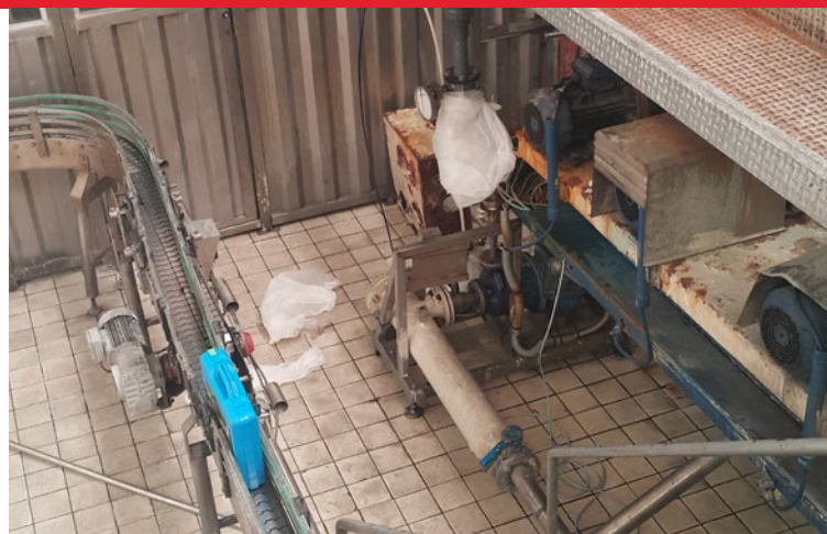
L'usine de Coca Cola à Marrakech, au Maroc.