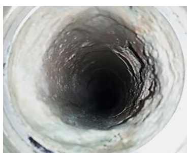
2 semaines après l'installation de Vulcan, le calcaire s'est amolli et est tombé.