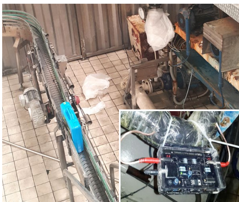
Vulcan 5000 a été installé sur la conduite principale de la salle de recyclage des eaux.