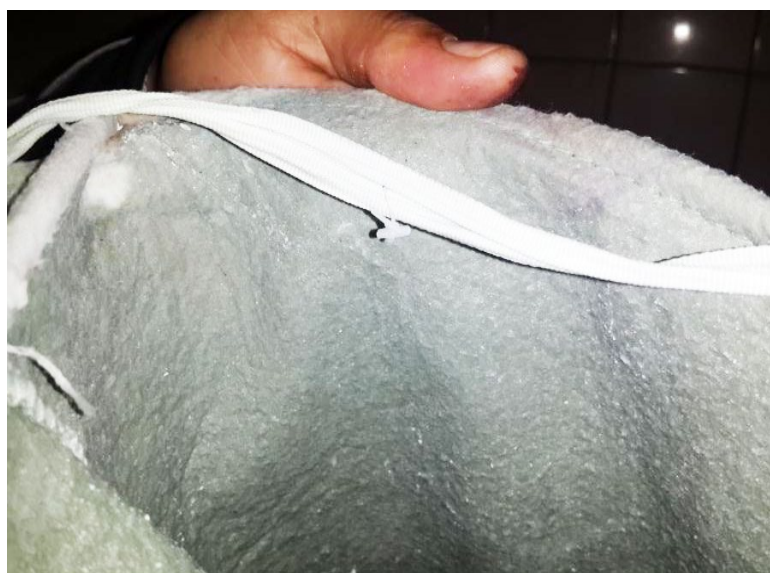
48 heures après l'installation de Vulcan, le filtre était toujours propre.