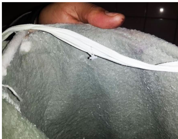
48 heures après l'installation de Vulcan, le filtre était toujours propre.