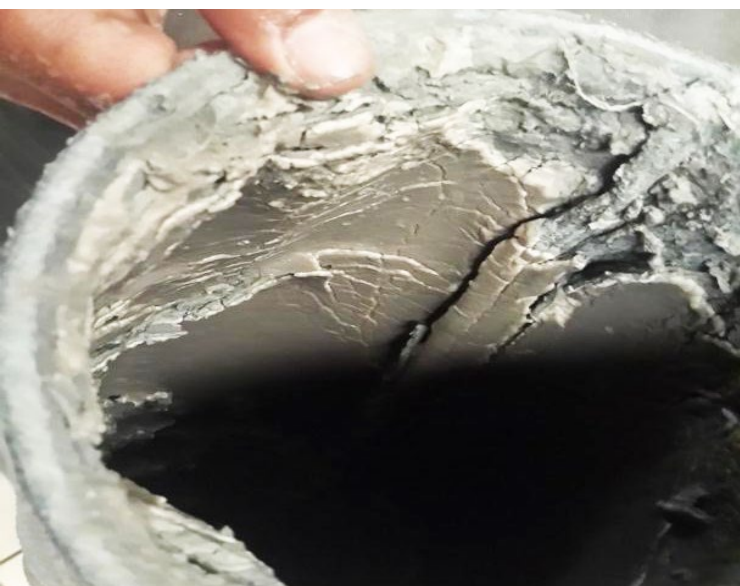
Sans Vulcan, le filtre était rapidement obstrué par les dépôts de calcaire et il devait être remplacé toutes les 48 heures.