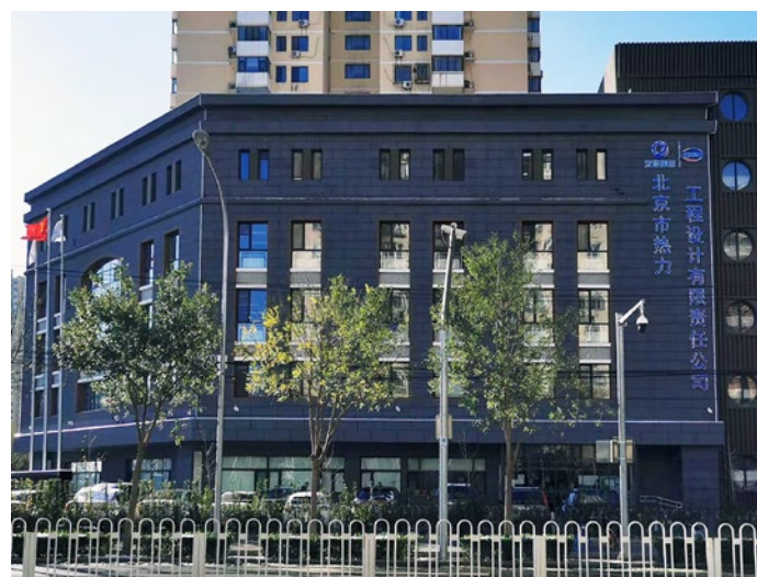
Beijing Thermal Engineering Co., Ltd.