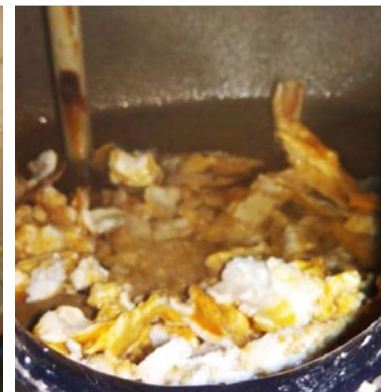
Fotos 2 y 3. Antes la cal cubría la resistencia y el sumidero (la fotografía se tomó en una de las habitaciones del hotel IBMA).