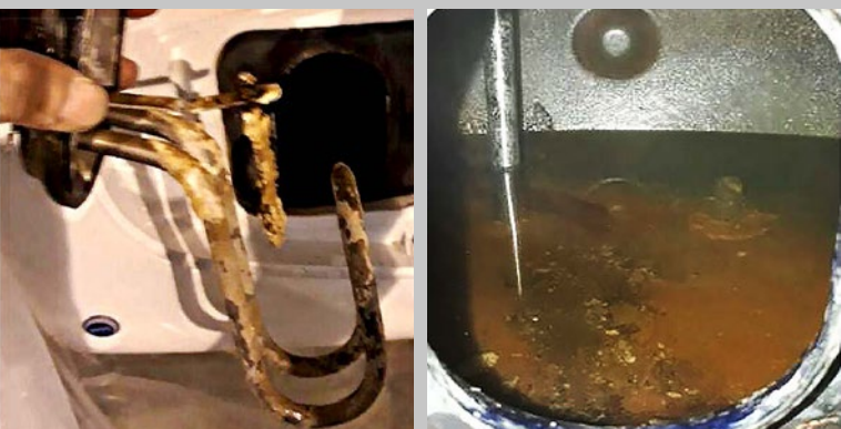
Fotos 4 y 5. 3 semanas después de instalar Vulcan, ya ha comenzado a eliminarse la cal.

Vulcan ha demostrado reducir exitosamente el tiempo, la energía y el capital que requiere el mantenimiento del circuito de agua del hotel. Todas las fotos se tomaron en una de las diez habitaciones que fueron observadas antes y después de la instalación de Vulcan, y en todas ellas los aparatos de calentamiento del agua ya no presentaban depósitos calcáreos.