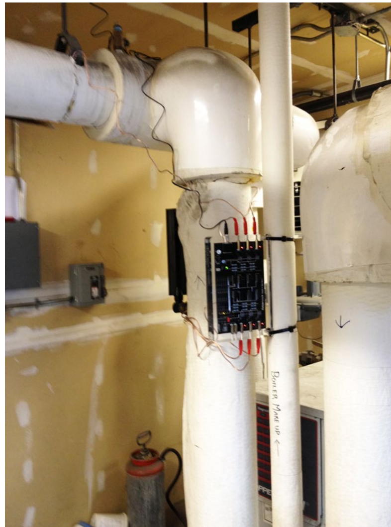
Vulcan S100 instalado en las dos calderas de agua caliente del Banco Umpqua. Las bandas impulsoras se cubrieron con aislante.