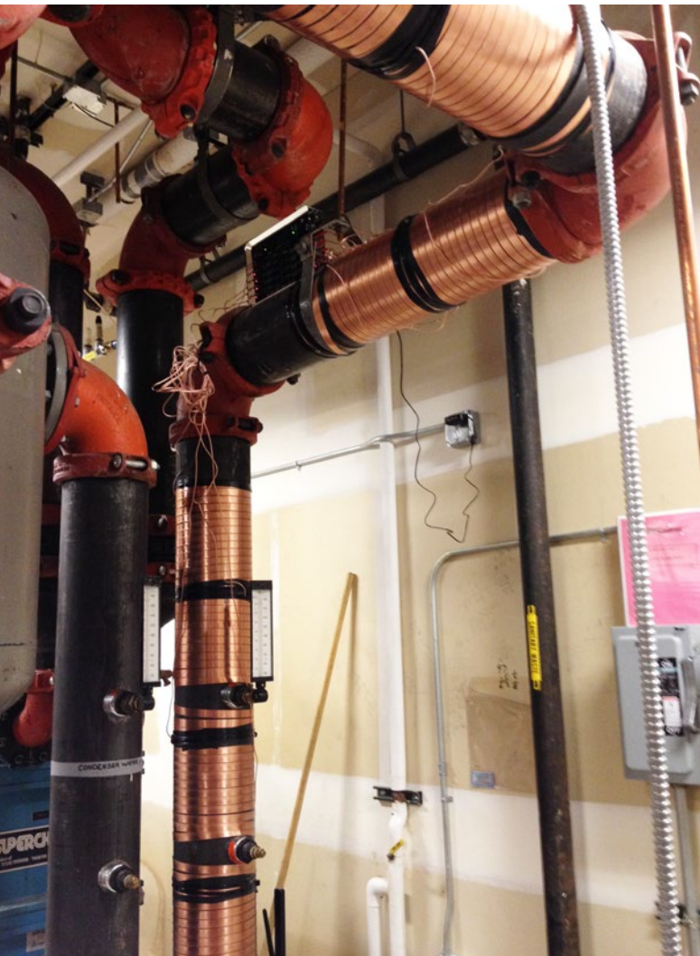
Vulcan S250 en la torre de refrigeración del banco.