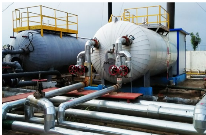
Entrada de agua de la calefacción del horno.