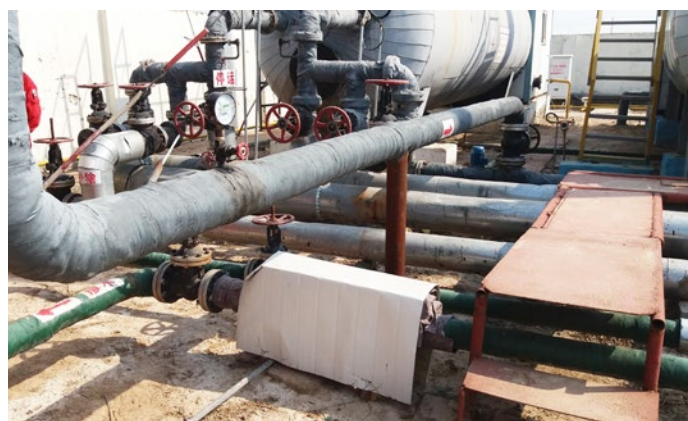
Instalación en el exterior con una cubierta hecha a medida para proteger la unidad del viento y el sol.