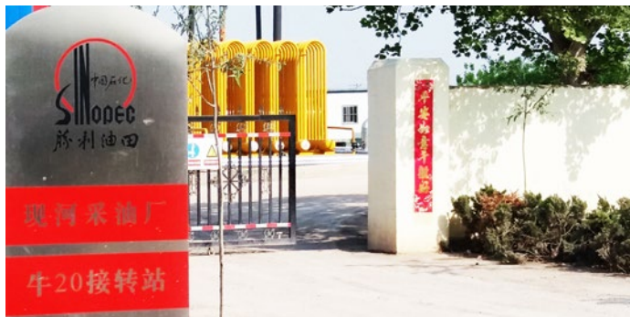
Puerta principal de la estación 20, planta de producción petrolera Xian-he.