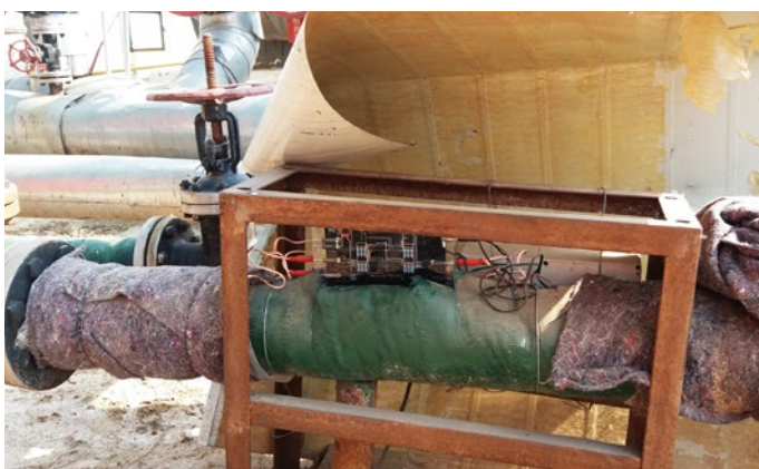
Antes de instalar Vulcan, se extrajeron el óxido y el aislamiento de la tubería. Las bandas impulsoras se enrollaron alrededor del tubo y se colocó nuevamente el aislamiento.

Para poder calentar el agua en la tubería, la temperatura del agua en el calentador del horno es de 70°C~80°C. Los tubos están marcados en rojo y tienen problemas de incrustaciones. El diámetro de la tubería es de 80 mm.