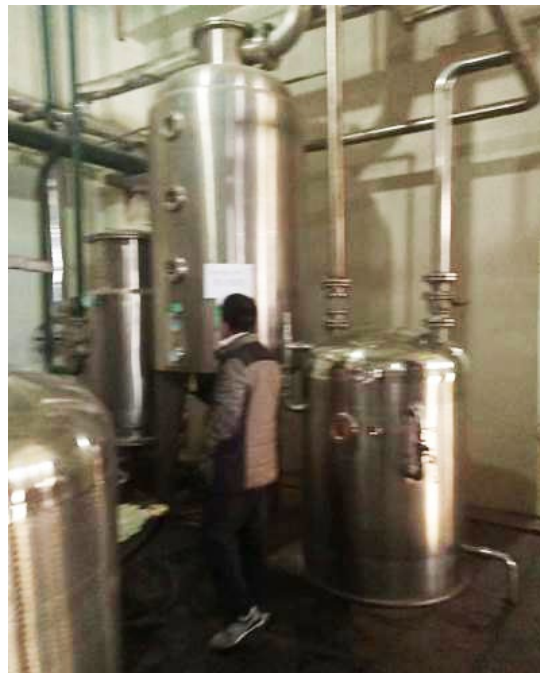
El tanque de enfriamiento del líquido de la medicina china.

En el proceso de producción de la medicina tradicional china, es necesario enfriar el líquido. Dado que la placa estaba muy incrustada esto afectaba la eficiencia del intercambio de calor, era necesario abrir la placa para su limpieza cada seis meses.