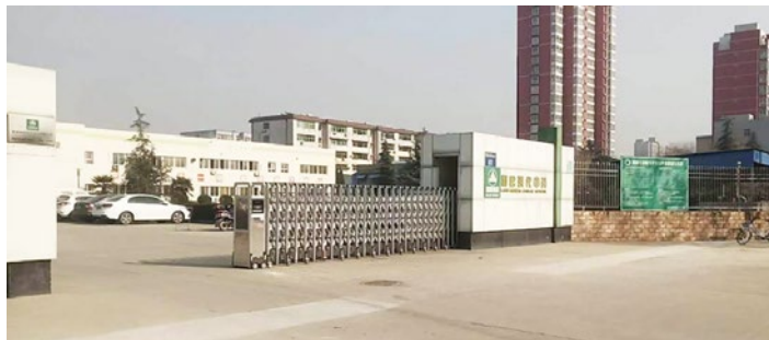
Fábrica china de medicina Lijun.

La Medicina China de Lijun tiene una larga historia de más de 300 años. Anteriormente, la empresa se conocía como „Hengxintang Pharmacy“, que se fundó a finales de la dinastía Ming. En la actualidad, se especializa en I+D, producción y venta de medicamentos chinos.