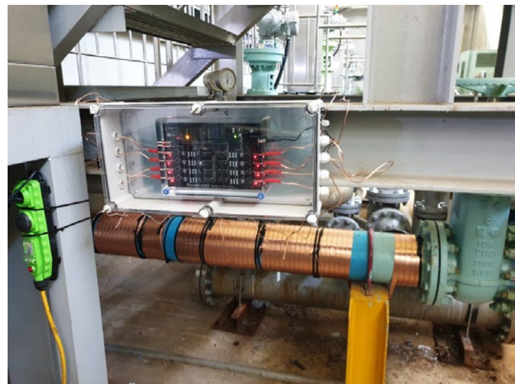
Instalación de Vulcan S250 en K-water

K-water estaba en contacto con clientes del equipo Vulcan de Corea, como Hyundai Motor Company y Toray Industries. Debido a los efectos positivos de Vulcan en esos contextos, K-water decidió instalar un equipo Vulcan S250 como su solución contra la cal.