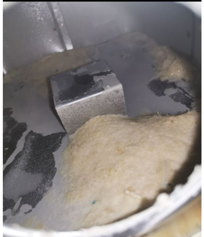
La vaporera después de 2 meses de uso de Vulcan S10

La cal se transformó completamente en polvo, por lo que no es necesario abrir la vaporera para limpiarla. Mediante la función normal de desagüe se puede mantener el depósito de agua caliente limpio y sin cal. Gracias a los buenos resultados obtenidos, realizaremos otra colaboración con Vulcan para los sistemas de suministro de agua y de aire acondicionado central del hotel.