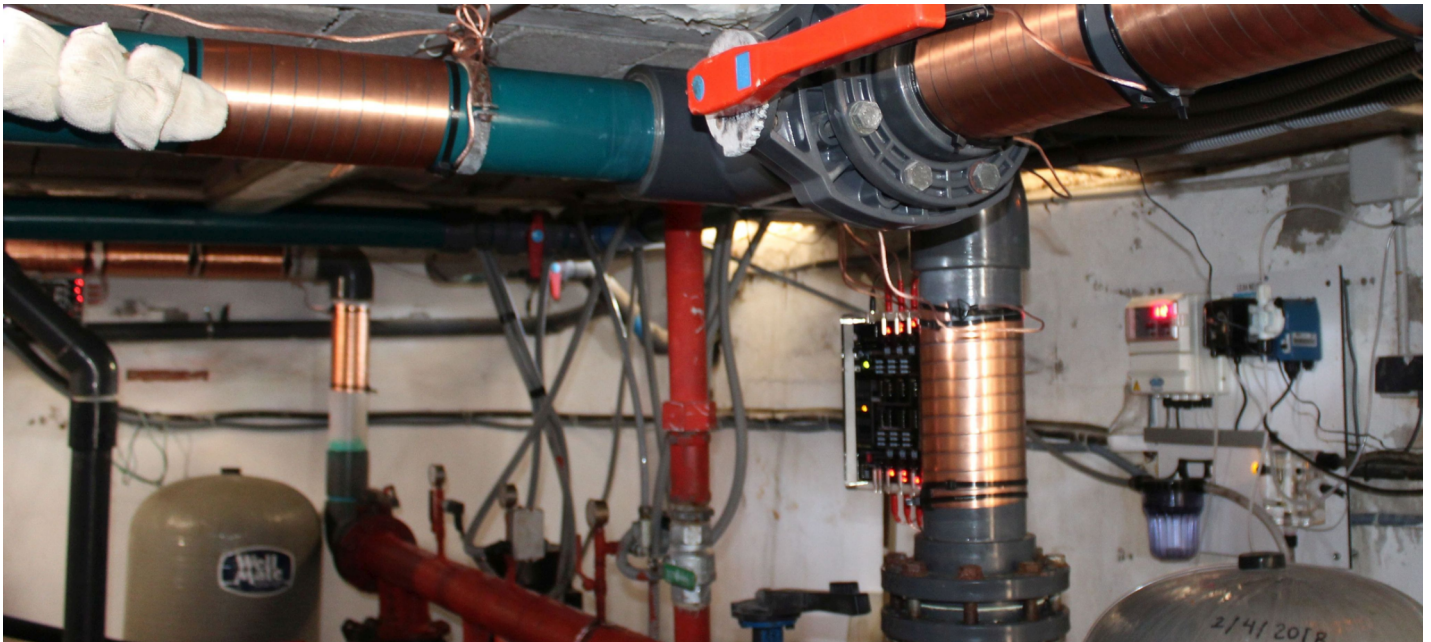
Vulcan S100 En tubos de agua fría general Ø 110 mm para una parte de los apartamentos y la caldera