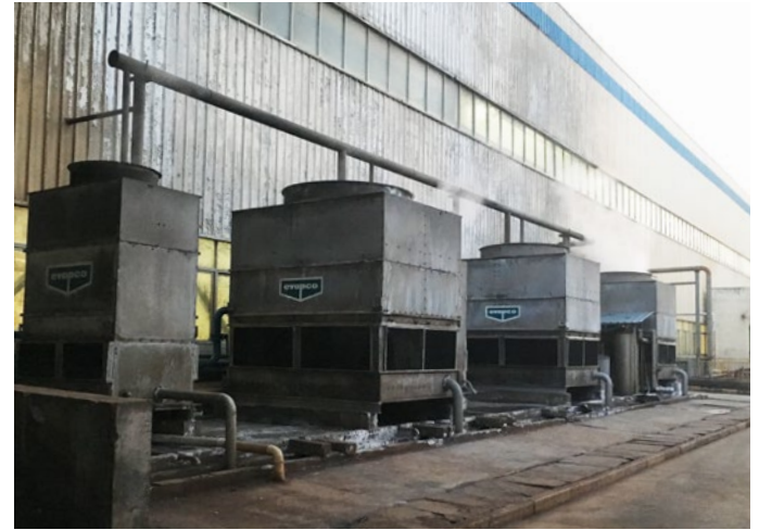
6 torres de refrigeración para la fábrica de moldes fueron tratadas por Vulcan S25.

Produce principalmente camisas de cilindro de alta potencia para camiones, maquinaria de construcción, motores marinos y grupos electrógenos. Tiene una capacidad de producción anual de 3 millones de camisas de cilindro.