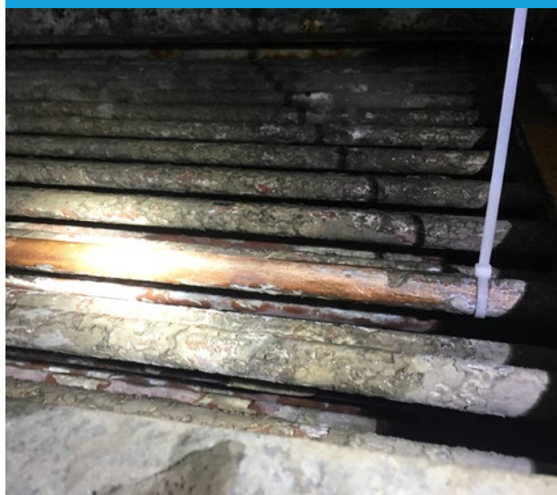
La tubería con un sujetacables se ha limpiado como referencia.