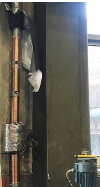
Vulcan S25 se instaló en la tubería principal de las torres de refrigeración de la fábrica de moldes.