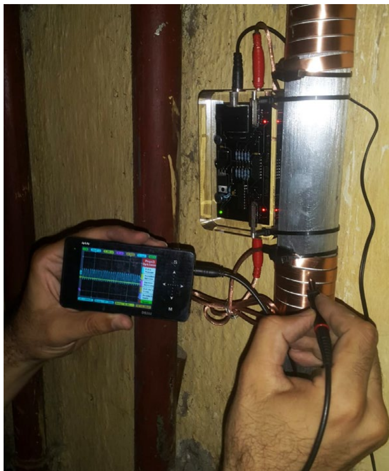
Prueba de funcionamiento de Vulcan con el detector de impulsos.