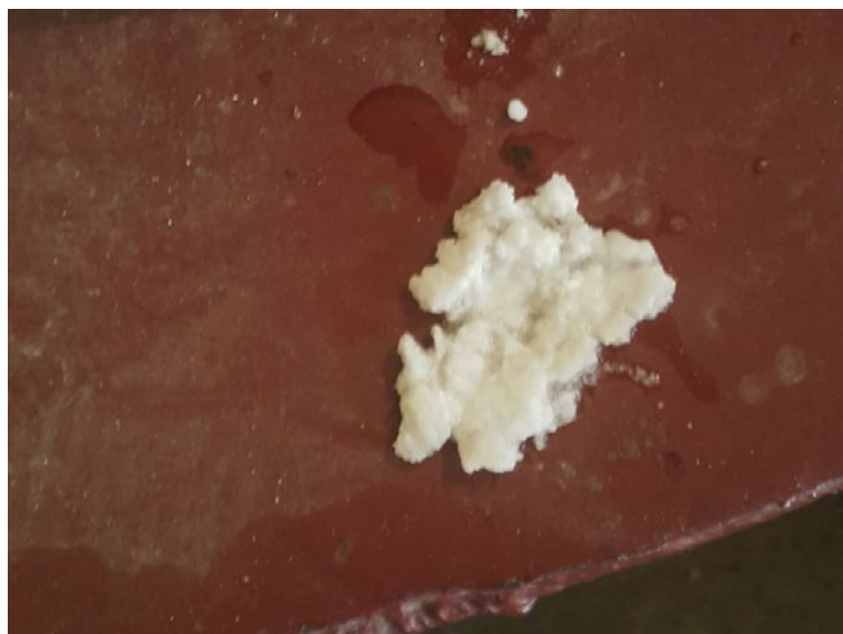
Tras 1 mes con Vulcan 3000, la cal se ablandó y fue fácil eliminarla.