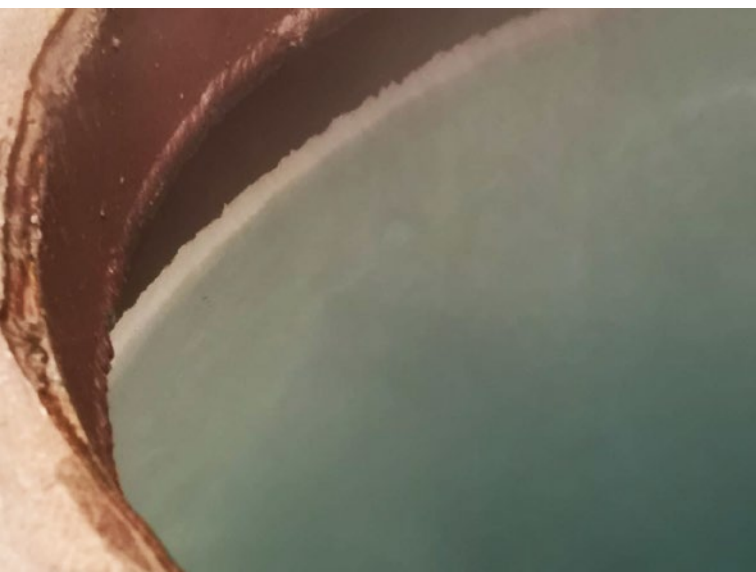
Antes de instalar Vulcan, el depósito de agua caliente estaba lleno de cal endurecida, la cual era muy difícil de eliminar.