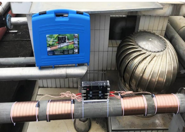
Vulcan S25 se instaló en la tubería principal de agua del edificio B de las habitaciones de huéspedes.

El Grupo Kunming Guanfang cuenta con un total de 5 hoteles de cinco estrellas. Debido a la exitosa prueba del Guanfang Hotel Honghe, la junta directiva del grupo ha decidido que todos los hoteles utilizarán el sistema anticálcico Vulcan cuando existan problemas de incrustaciones.