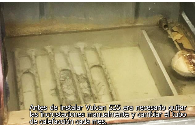
Antes de instalar Vulcan S25 era necesario quitar las incrustaciones manualmente y cambiar el tubo de calefacción cada mes.