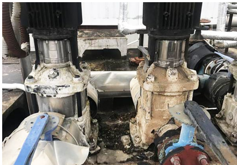
Izquierda: tubería (sin incrustaciones) después de 2 meses de instalación de Vulcan S25. Derecha: tubería sin tratamiento del agua.