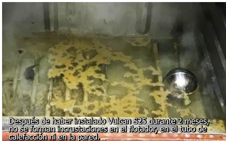
Después de haber instalado Vulcan S25 durante 2 meses, no se forman incrustaciones en el flotador, en el tubo de calefacción ni en la pared.