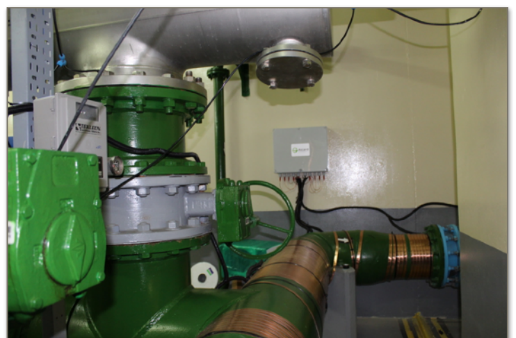
La unidad Vulcan S500 instalada en el cuarto de bombas.