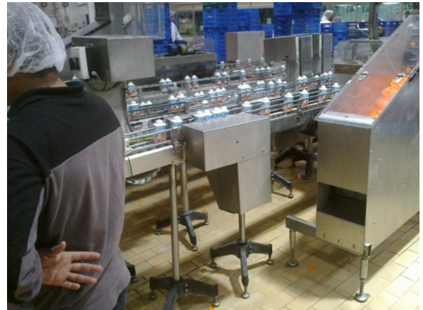
Producción de leche