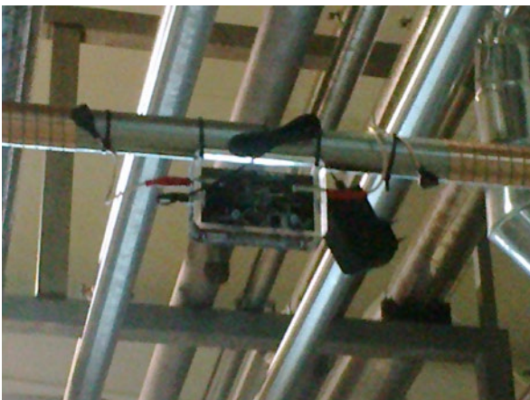
Vulcan 3000 instalado en la fábrica de Delice Danone