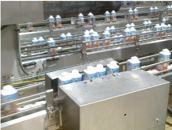
Producción de leche

La división de Productos Lácteos Frescos produce y vende productos lácteos y otras especialidades lácteas fermentadas. En este contexto, Danone confía en su capacidad para desarrollar su oferta e introducir continuamente nuevos productos en términos de sabor, textura, ingredientes, contenido nutricional o envasado. Sus marcas incluyen el yogur griego Activa, Oikos y el yogur para niños Danone.