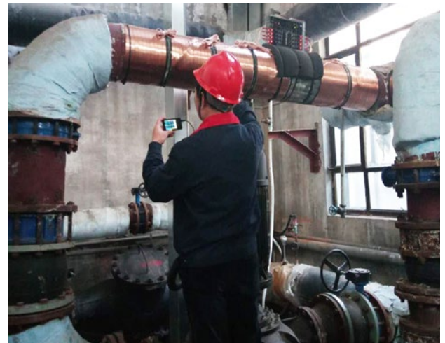
Se instaló Vulcan S250 en la tubería de entrada.