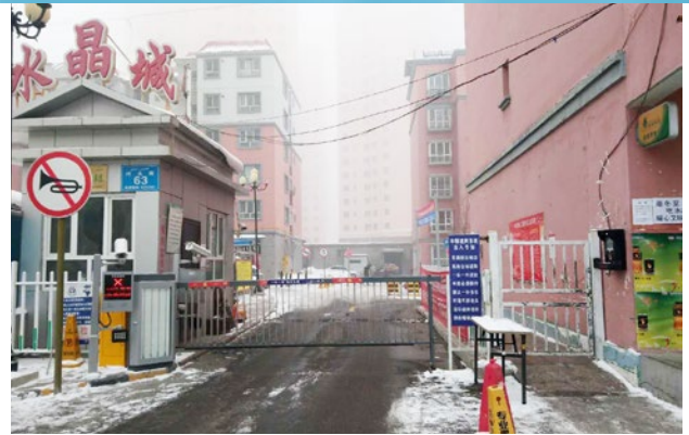
Comunidad Crystal City

Antes de instalar Vulcan S250 se procedió a limpiar las placas del intercambiador de calor. Durante el periodo con Vulcan no se empleó ningún descalcificador de agua u otro tratamiento. Tras la temporada de calefacción, se abrieron las placas y aún estaban limpias.