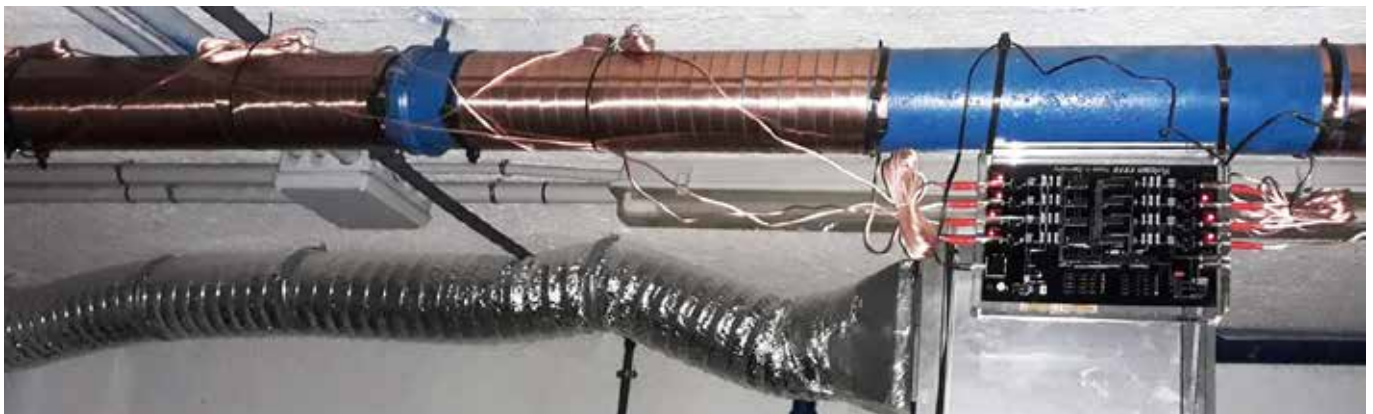
Paso 2: Se instaló la unidad S250 en la tubería principal de agua