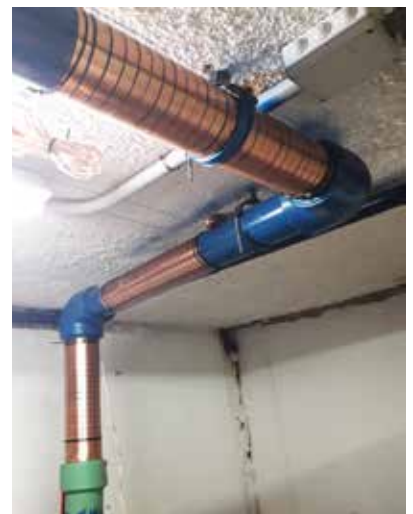
Paso 1: Se instalaron las bandas de impulso