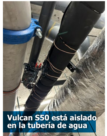
Vulcan S50 está aislado en la tubería de agua