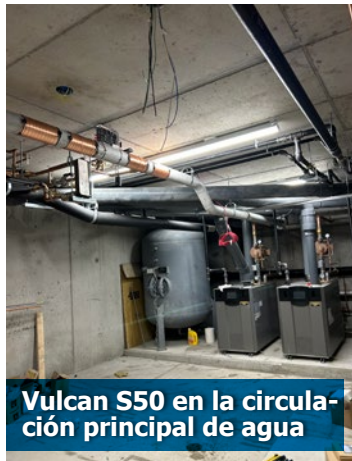
Vulcan S50 en la circulación principal de agua