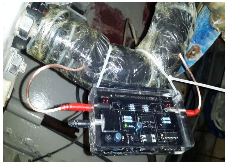
Vulcan 5000 se instaló en la entrada de agua del cuarto de reciclaje de agua.