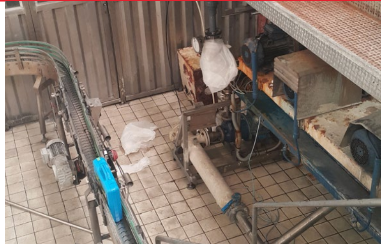
Fábrica de Coca-Cola en Marrakech, Marruecos.