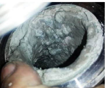
Antes de la instalación de Vulcan: la tubería estaba llena de incrustaciones.