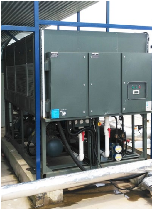
Sistema principal de aire acondicionado

Tong-Cheng Travel es una empresa china líder en turismo. El distribuidor de CWT - Xinriyuan se hizo cargo de todas las obras de aire acondicionado del edificio. La mayor parte del aire acondicionado utiliza un sistema evaporativo de alta eficiencia, y requiere agua de muy alta calidad. Para asegurar el buen funcionamiento a largo plazo del intercambiador de calor y también para evitar la formación de incrustaciones, Vulcan S100 se incluyó en el paquete con el sistema evaporativo de aire acondicionado.