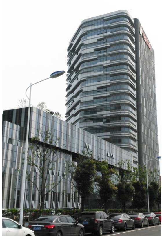
La sede central de Tong-Cheng Travel