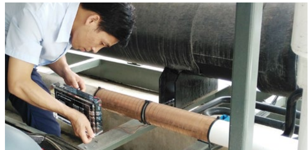
Instalación de Vulcan S100