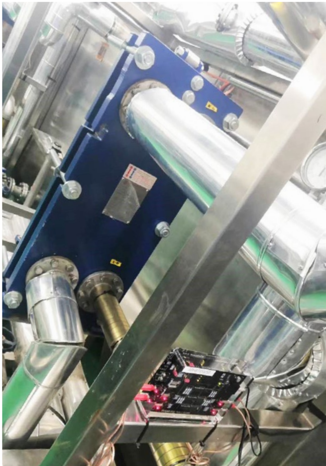
Vulcan S50 fue instalado antes del esterilizador.

TCI (Shanghai) es un diseñador de productos profesionales y fabricante de ODM. Entre la variedad de productos innovadores que elabora se encuentran alimentos funcionales tales como bebidas y tabletas con suplementos, y productos para el cuidado de la piel tales como máscaras y esencias para la piel.