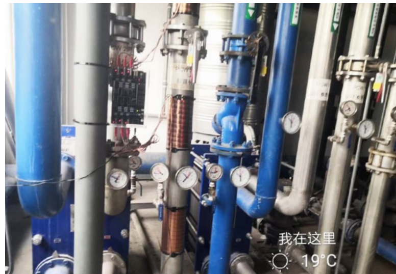
Vulcan S100 fue instalado antes del recalentador.