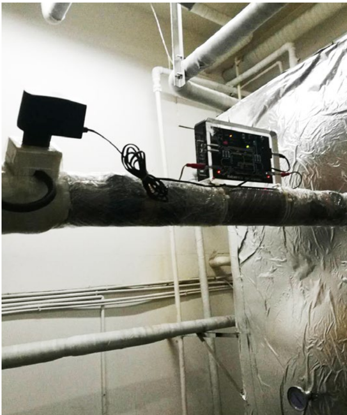
Vulcan S10 se instaló frente al intercambiador de calor para resolver los problemas de incrustaciones del mismo, las bombas de agua, el depósito, los cabezales de ducha y todo el sistema de tuberías.

Hutong es un elemento cultural del antiguo Pekín, el Hotel Huguosi está situado en un hutong.