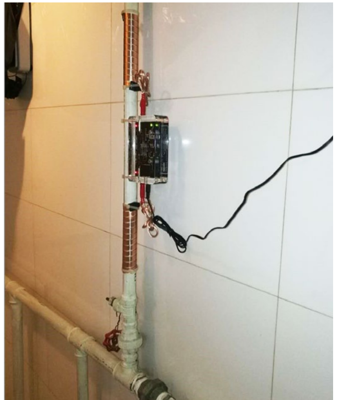
Vulcan 3000 se instaló en una tubería de agua del colector solar para resolver el problema de incrustaciones de los tubos de vacío.