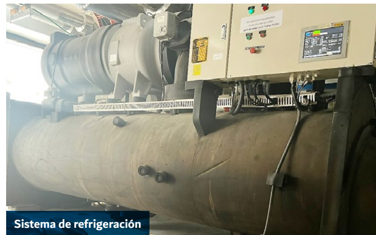
Sistema de refrigeración