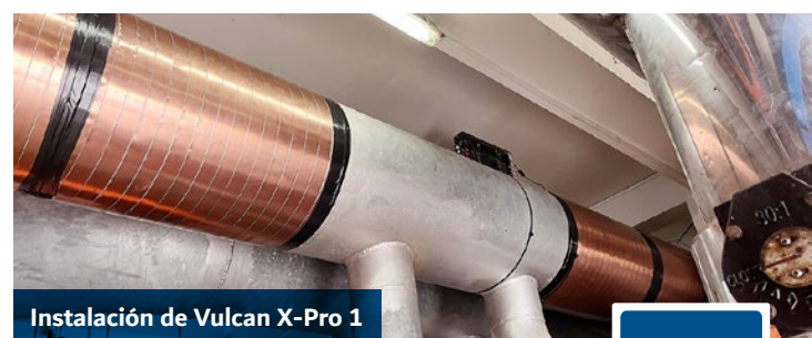
Instalación de Vulcan X-Pro 1