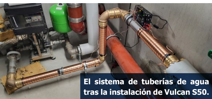
El sistema de tuberías de agua tras la instalación de Vulcan S50.