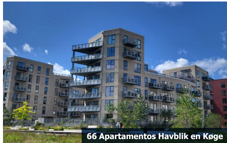
66 Apartamentos Havblik en Køge