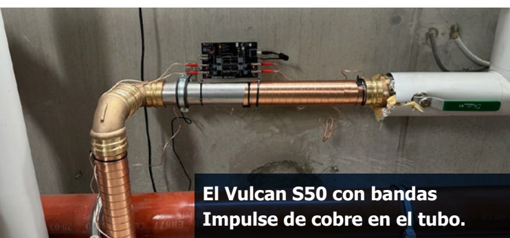
El Vulcan S50 con bandas Impulse de cobre en el tubo.