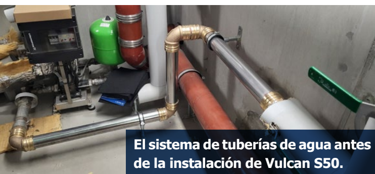
El sistema de tuberías de agua antes de la instalación de Vulcan S50.