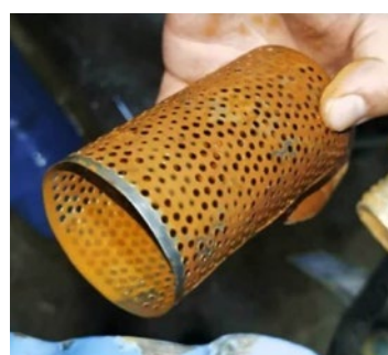
Equipo de caldera antes de usar Vulcan