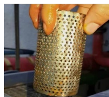
Equipos de calderas después de 3 meses utilizando Vulcan